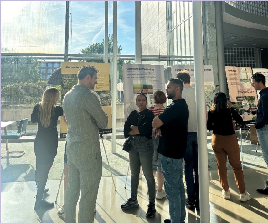
Uitleg van het projectteam over het plan